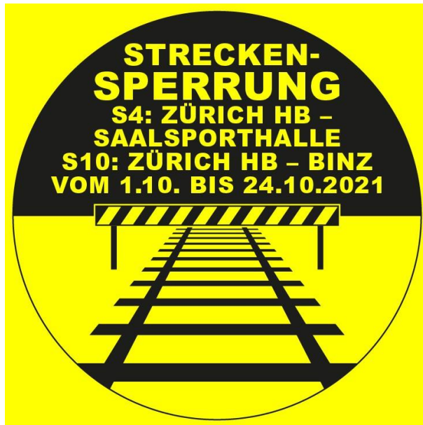
Ankündigung der Streckensperrung auf der S4 und der S10.