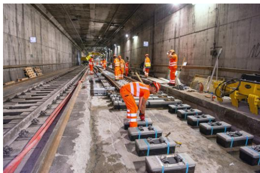
Die Schwellenblöcke werden platziert...