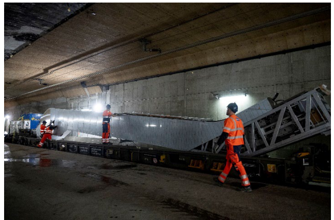
Die Rolltreppen wiegen je rund zehn Tonnen.