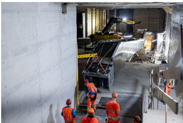
Aufgrund der engen Platzverhältnisse im bestehenden Tiefbahnhof war ein Höchstmass an Präzision erforderlich.