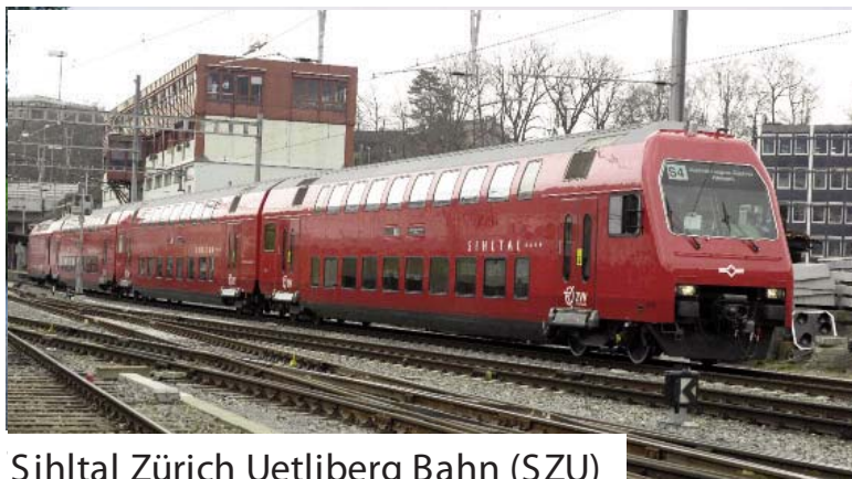
Sihltal Zürich Uetliberg Bahn (SZU)

Die Dimensionen sind gemäss ihrem Gewicht im Index Fahrleistung von links (grösstes Gewicht) nach rechts (kleinstes Gewicht) geordnet.