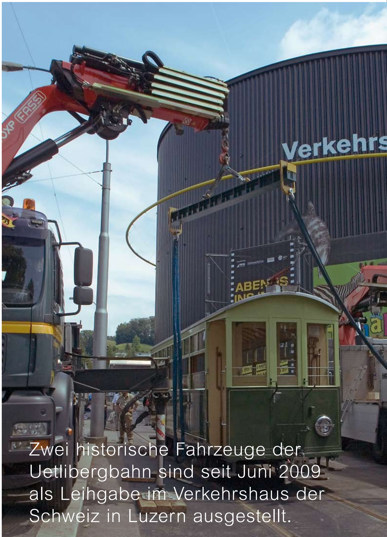
Zwei historische Fahrzeuge der Uetlibergbahn sind seit Juni 2009 als Leihgabe im Verkehrshaus der Schweiz in Luzern ausgestellt.